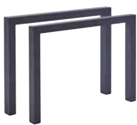
Palermo Beine-Paar – Edelstahl Dunkelgrau, pulverbeschichtet