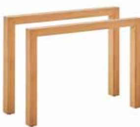
Palermo Beine-Paar – Premium Teak