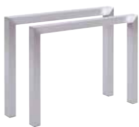
Palermo Beine-Paar – Edelstahl/304