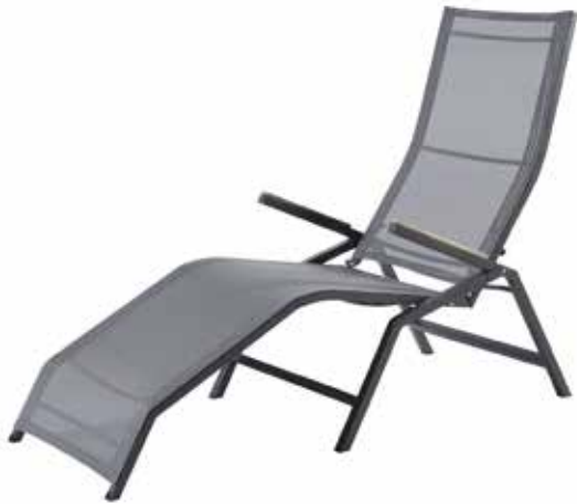
Valencia Relax Liege, Schwarz/Silber (Abb.)