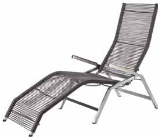
Atlanta Relax Liege, Rope Mocca (Abb.)