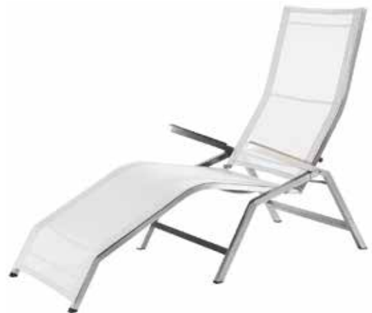
Venedig Relax Liege, Silber/Weiß (Abb.)