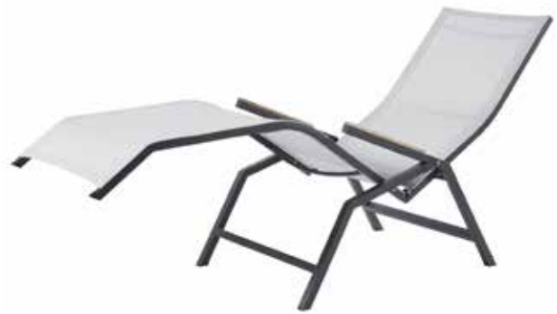
Valencia Relax Liege, Silber/Weiß (Abb.)