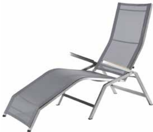
Venedig Relax Liege, Schwarz/Silber (Abb.)