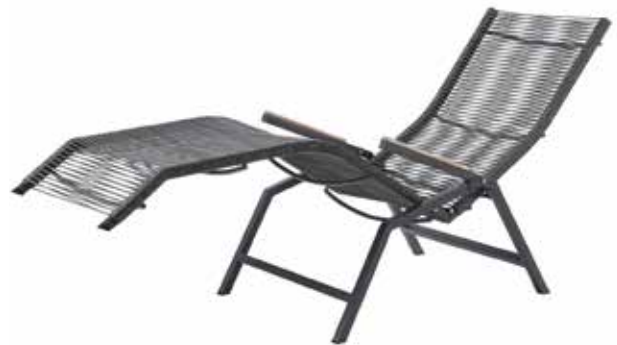
Valencia „Rope“ Relax Liege, Rope Grau (Abb.)